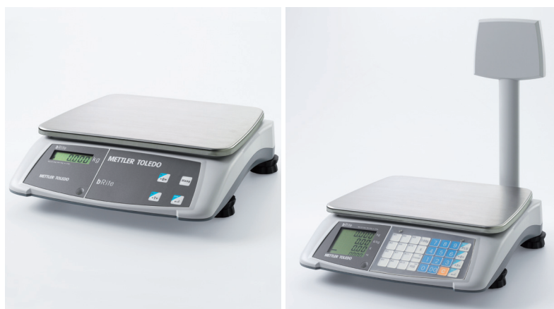
bRite solo bilancia